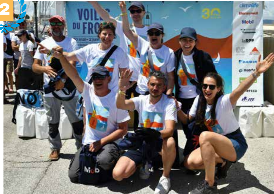
2 e place : Dalkia Froid Solutions