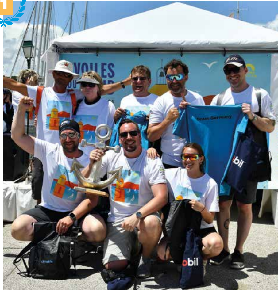
1 ère place : Germany