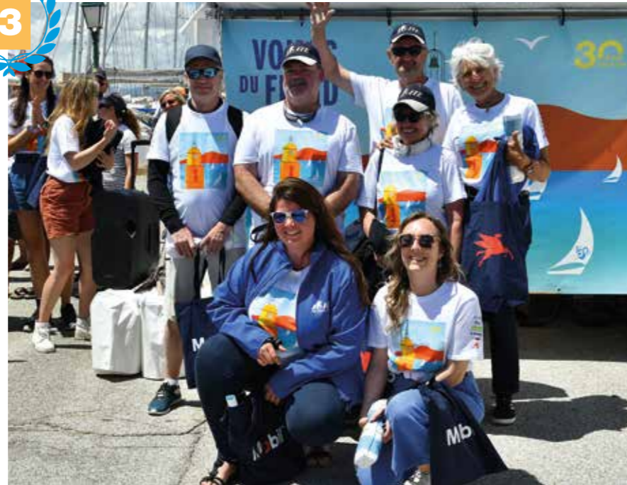
3 e place : ITE